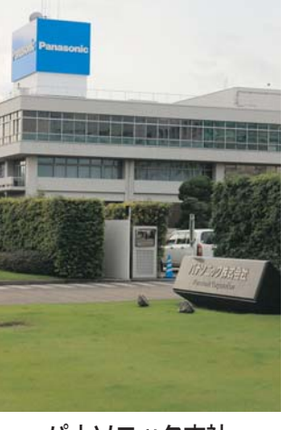
パナソニック本社

ソニーの代表取締役社長兼CEOの吉田社長は、ソニーの今後の戦略について述べた。ソニーは、ゲーム、音楽、映画、金融、あらゆる面でダメージを受けている。ソニーは、ゲーム、音楽、映画、金融、あらゆる面でダメージを受けている。