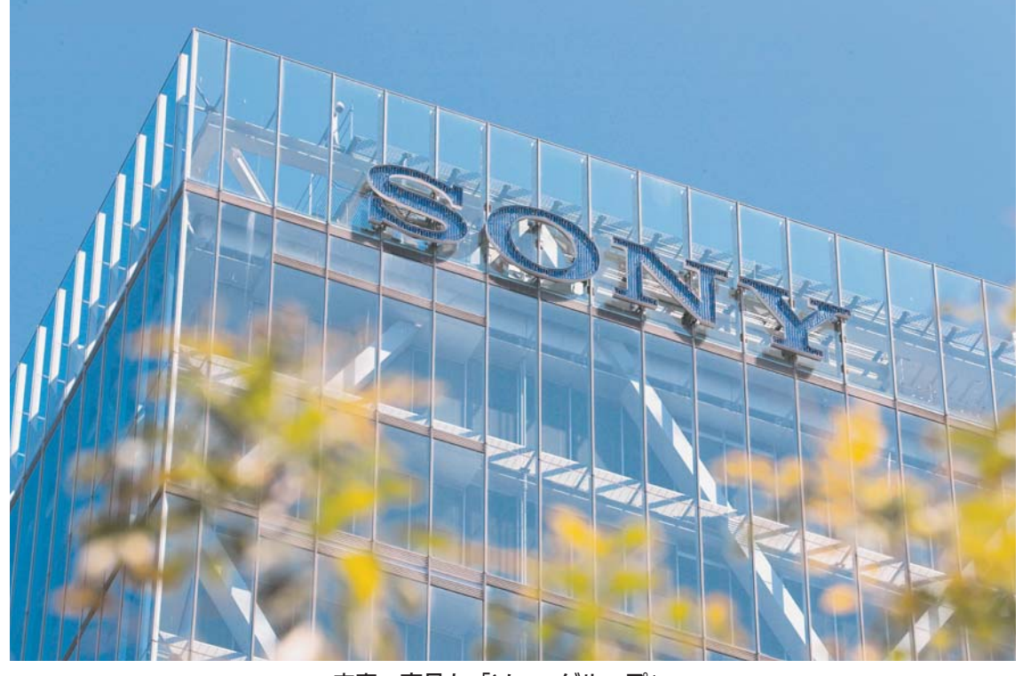
来春、商号も「ソニーグループ」へ

本社(TEL)03-5644-7000東京都中央区日本橋小網町14-1/大阪支社(TEL)06-6946-3321大阪府中央区北浜東2-16/名古屋支社(TEL)052-931-6151名古屋市中区東2-21-28/西部支社(TEL)092-271-5711福岡市博多区古門戸町1-1