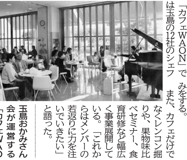
玉島おかみさん(代表)が中心で進んでいる。

社内免許を検討 「熟練者の背中 を見て育つ時代 はない。若手の活 躍を促すには、一 人ひとりの力を 伸ばす必要がある 。公的資格以外 に、社内免許を 取得させること も有効だ。」