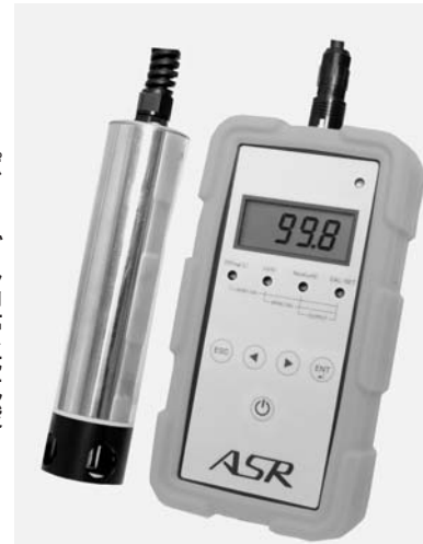
ポータブル型蛍光式酸素濃度計DOP-01