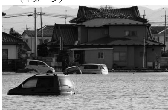
災害時には適切な指示が必要となる(イメージ)

MS&ADインシュアランスグループホールディングス傘下のインターリスク総研(東京都千代田区)は、大規模災害時における企業の安全配慮義務に関するリスクコンサルティングサービスを年内に開始する。企業にとって分りにくい「安全配慮義務」について考え方のモデルを紹介したり、企業の体制を診断したりして、企業が従業員に適切な指示を出せるよう指導する。サービス開始1年で20件の受注を目指す。