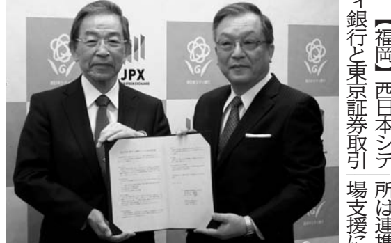
【福岡】西日本シティ銀行と東京証券取引場支援に取組む。6日、資本市場に関する連携協定を結ぶ。左から、西日本シティ銀行の取締役、東証の代表取締役。

地震や津波などの大規模災害時には、従業員の死傷を防ぐため企業が安全配慮義務を考慮した適切な指示を出すことが求められている。東日本大震災後は、被災従業員への指示が適切だったかを巡り、裁判も起こった。ただ、安全配慮義務は判例が少なくガイドラインもないため、企業単独での対策が難しい。